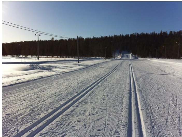
Bjuder på en bild från skidstadion idag, Puss!

Annars så kan man ju inte annat än börja smålängta lite till våren nu när värmen och solen kommit! :)