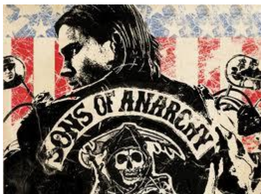
Rätt snygg kille med i serien ;)

Men nu ska jag sätta mig och kolla lite Sons of Anarchy och bara mysa, blir att åka upp och hejja på alla skidskyttar imorgon och träna lite själv förhoppningsvis!