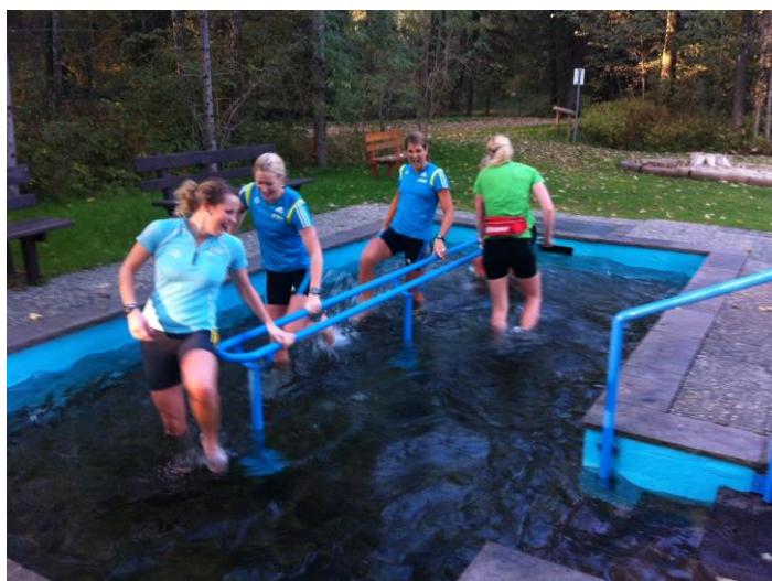
A-M gissade att vattnet i bassängen var ungefär 2 grader, brrr!

Men nu blir det möte och sen ska jag försöka få lite plugg gjort.. Overandout.