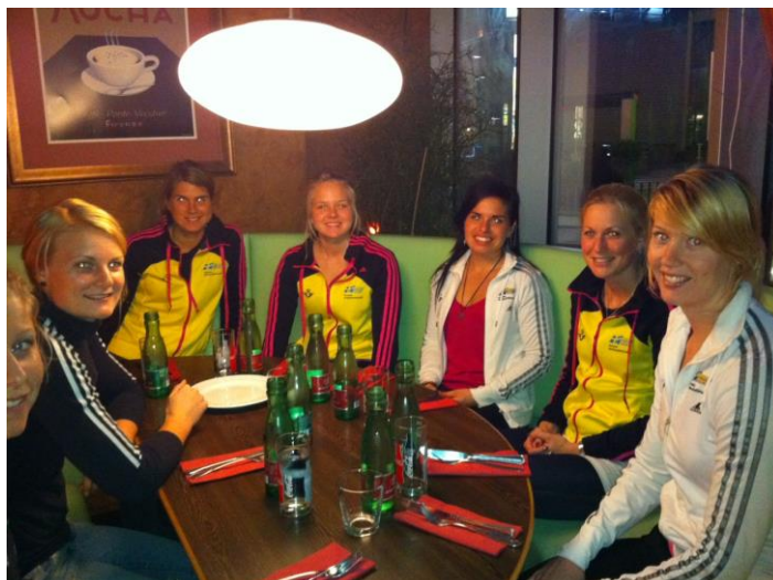
Bjuder på en bild från dagens middag i Salzburg, taggade brudar!