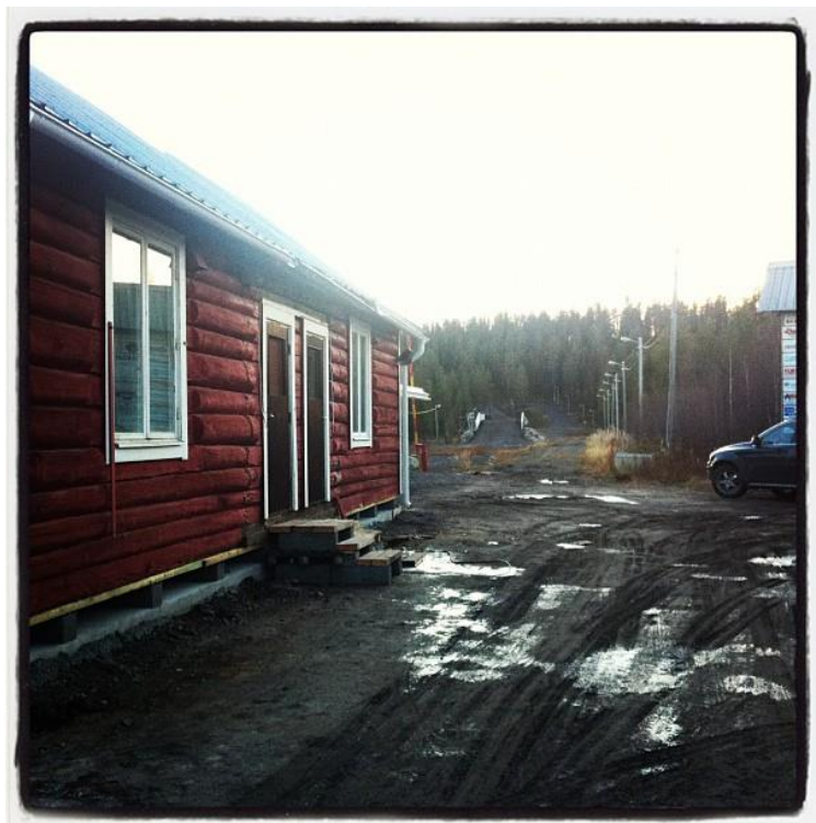
Här är en bild på nya klubbstugan på Rymmarstadion förresten, bli nog superbra när det är färdigt!