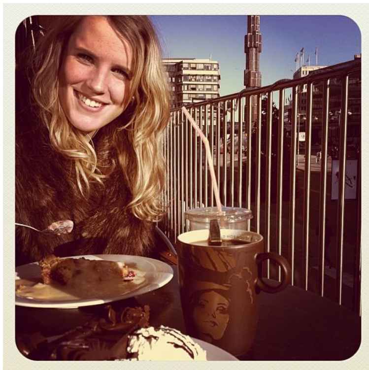
Har skaffat Instagram för att redigera och lägga upp bilder, vad tycks? Denna bild är från ett fik intill Sergels torg i underbart höstväder!