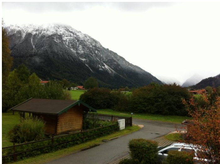
Här är en bild som tagits från våran balkong, nu får det sluta snöa!