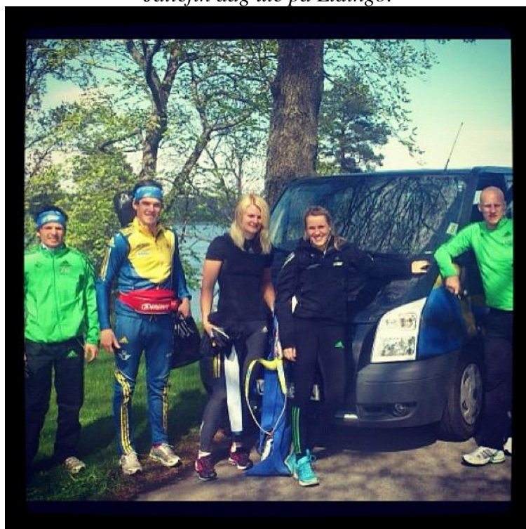
Delar av laget efter ett avklarat skyttepass.