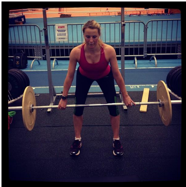
Och ett av styrkepassen på Bosön..