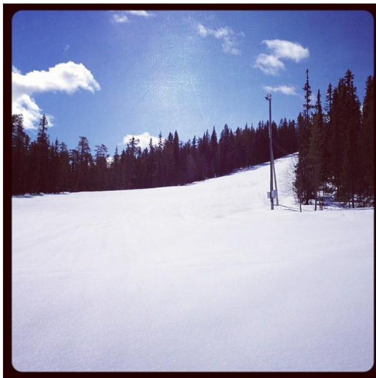
Full vinter var det hemma i Arvidsjaur förra veckan