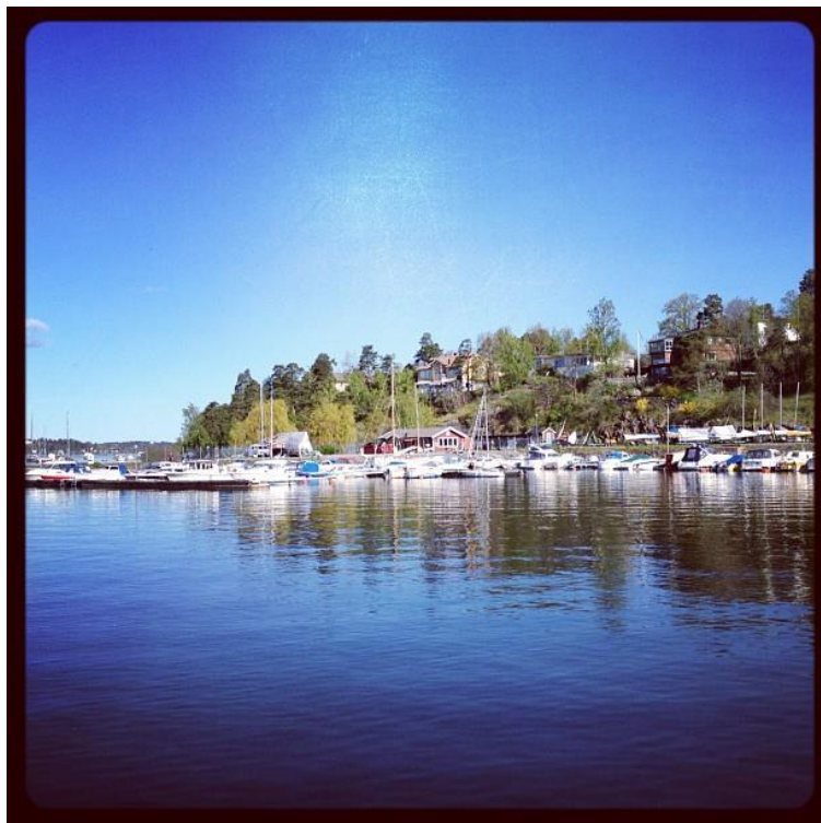
Jättefin dag ute på Lidingö!