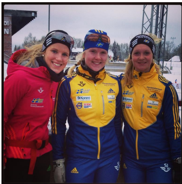
Nöjda tjejer efter en rolig helg tillsammans!