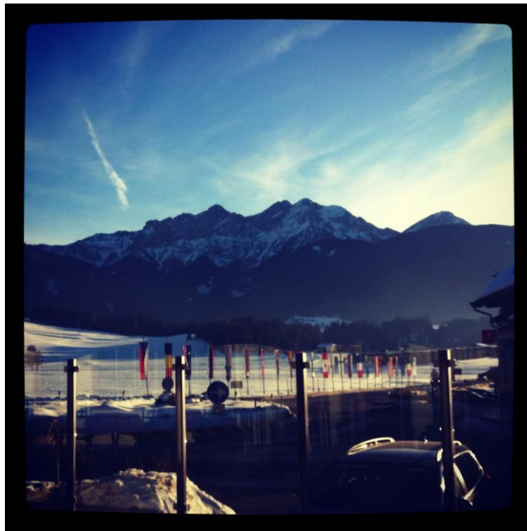
En bild från Italien ifjol, verkligen fint!

Men nu ska jag fokusera på tvn igen, hörs från Italien! kram