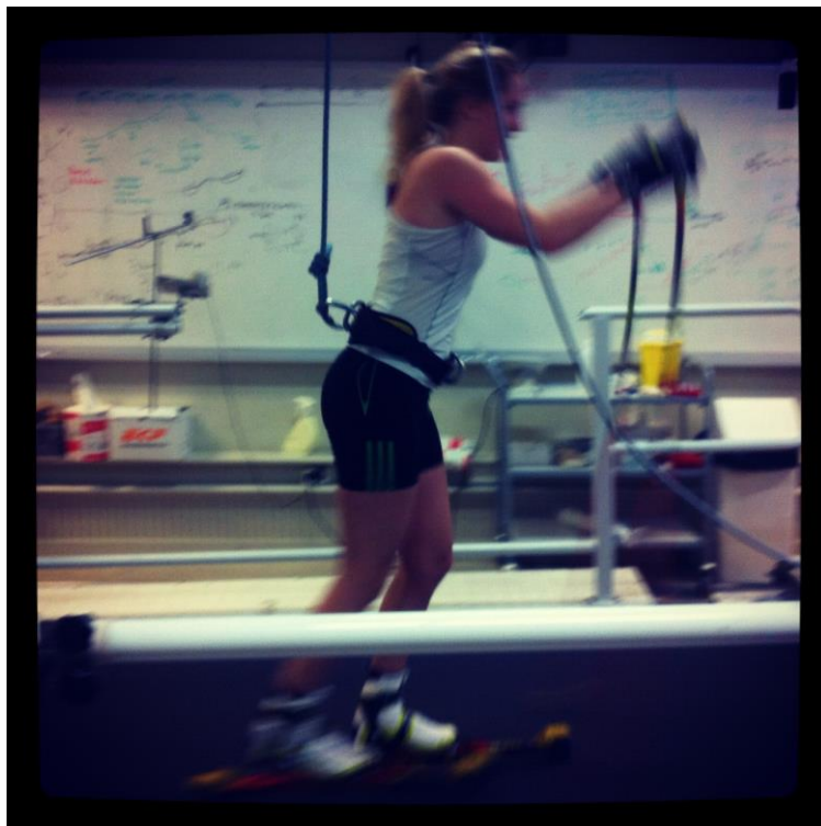
Ett av passen inne på rullbandet på Vintersportcentrum!