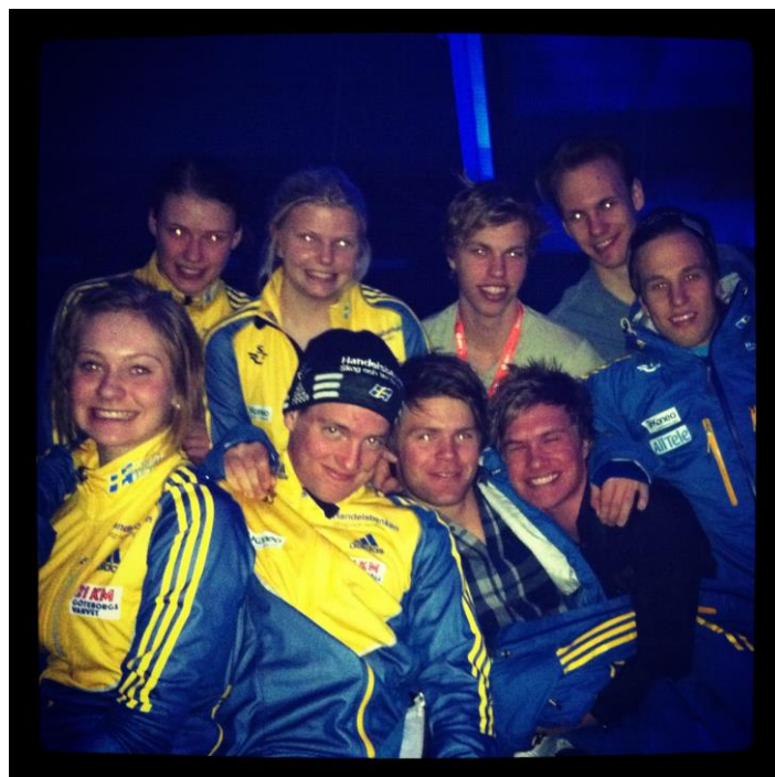
En gruppbild på några av svenskarna under invigningen!