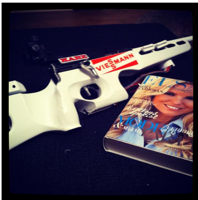
Bössan är numera vit och hann läsa en bok under min förkylning.