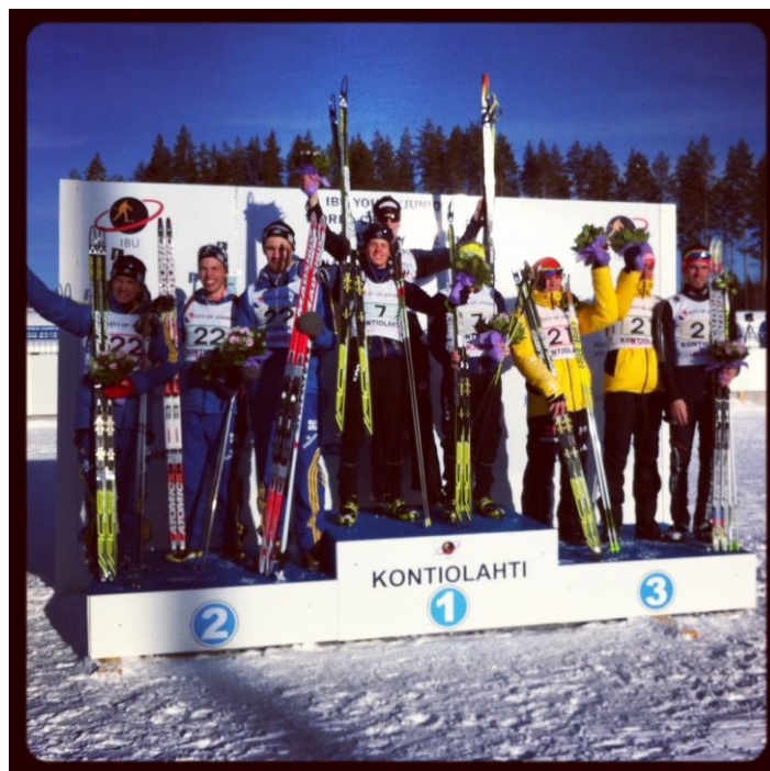
Silver-grabbarna sken ikapp med solen på pallen igår! :)