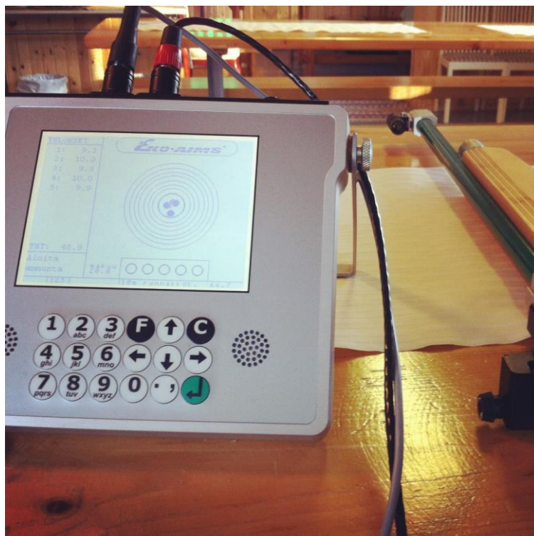
Min rekordserie på 48,9!