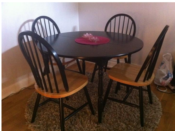
Har ju glömt visa hur mitt "matbordsprojekt" blev.. ganska fint va?